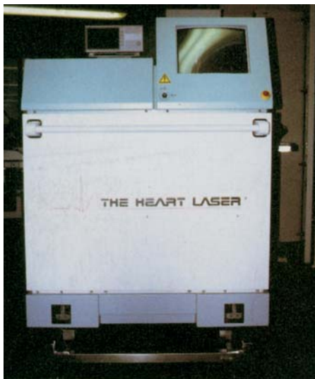
Abb. 1: Heart-Laser mit Touchscreen zum Anlegen von Kanälen am schlagenden Herzen

Das Laserführungssystem besteht aus einem mit sieben Spiegeln versehenen Gelenkarm, einer Fokussierlinse sowie spezi-