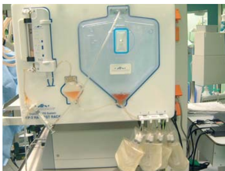
Thrombin und Cryopräzipitat am Harvest Rack des ThermoGenesis-Systems

Die Herstellung von APG ist seit einigen Jahren bekannt. Der erste Ansatz war das Gerät „Sequestra“ von Medtronic, welches PRP als Grundlage für Platelet-Gel separieren konnte. Die Herstellung des Gels selbst war eine manuelle Angelegenheit. Mittlerweile stehen einige, teils vollautomatische Devices für die Herstellung von APG zur Verfügung. Auf dem deutschen Markt ist dies vor allem das System Magellan von Medtronic. Ferner sind derzeit noch folgende Systeme im Handel: Bio-Med GPS, SmartPrep von Harvest Tech. sowie Sequire. Die sich schnell erweiternde Palette von Geräten zeigt auch, dass die Industrie einen wirtschaftlich vielversprechenden Ansatz in diesem Anwendungsbe- reich sieht.