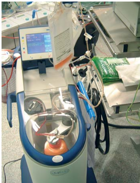
Separierung von PRP

Verschiedene Arbeitsgruppen haben vor allem den postoperativen Blutverlust, die Gabe von Fremdblut und -plasma sowie die Dauer des Klinikaufenthaltes mit einem Vergleichskollektiv untersucht und sind dabei zu teilweise hochsignifikanten Ergebnissen gekommen. Der Erfolg wurde darauf zurückgeführt, dass konsequent versucht wurde, ein möglichst großes Volumen von frei zirkulierenden Platelets zu separieren (im Durchschnitt 27 %). Dieses Verfahren ist nach unseren Erfahrungen auch noch nach Beginn der EKZ sinnvoll und mit einem modernen Cell-Saver