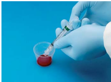
Herstellung von Thrombozyten-Gel

Als letzte Stufe dieser Kaskade ist derzeit die Gewinnung von autologem Thrombin und Fibrinkleber anzusehen. Gerade die schnelle und zuverlässige Gewinnung von Thrombin stellte bislang ein Problem dar, so dass vielfach auf bovines Thrombin ausgewichen wurde. Die allergischen Reaktionen auf bovines Thrombin waren zwar verhältnismäßig selten, jedoch ist der Einsatz solcher Produkte in Zeiten von BSE nicht mehr angebracht.