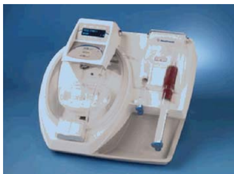
Magellan-System für APG von Medtronic

dung von APG bei chronischen Wunden. Die Vergleiche im Wundheilungsprozess vorher – nachher sowie Aufnahmen von einem Vergleichskollektiv hinterließen bei allen den nachhaltigen Eindruck, dass es sich eben nicht um einen billigen Trick handelt, sondern dass wir mit dieser Behandlungsform dem Patienten zu einem risikofreien und effektiven Benefit verhelfen können. Dabei ist vor allem die Wirkung der Wachstumsfaktoren (GF) von entscheidender Bedeutung. Die Erforschung dieser Wirkungsmechanismen bietet uns aber noch eine Herausforderung. Darüber hinaus ist die autologe Blutkomponententherapie im Vergleich zu Verfahren mit Fremdmaterial nicht nur deutlich sicherer, sondern in der Konsequenz auch billiger.