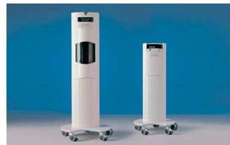
Vivostat-Prozessor für Fibrin-Glue und Spray-Applikator

Diese Entwicklungen zeigen, dass die Forschungen bei den autologen Blutkomponenten noch nicht zum Stillstand gekommen sind und uns in naher Zukunft sicher noch einige Überraschungen bieten können.