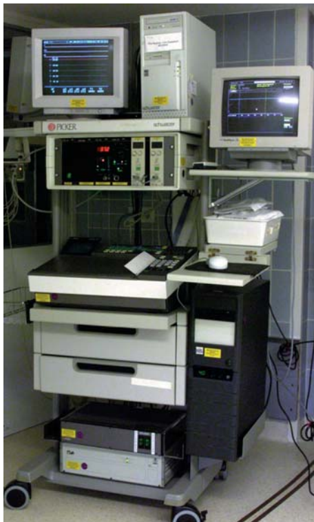
Abb. 1: Herzdruckmessplatz

Jeder Herzoperationsaal verfügt über einen eigenen multifunktionalen physiologischen Messplatz. Die Messplätze dienen in erster Linie der kontinuierlichen Überwachung der invasiven Blutdruckwerte, des Oberflächen-EKGs und der Herzfrequenz während der Operation. Darüber hinaus werden die Messplätze auch zur intrakardialen Prael/post-Druckmessung genutzt. Der bei uns verwendete physiologische Messplatz PD 14 der Firma Schwarzer besteht aus drei Hauptkomponenten: einer Verstärker- und Registriereinheit (Abb. 1 li.), einem Auswertesystem (Abb. 1 re.) und einer Patientenanschlussbox (Abb. 2) mit eingebautem Vorverstärker.