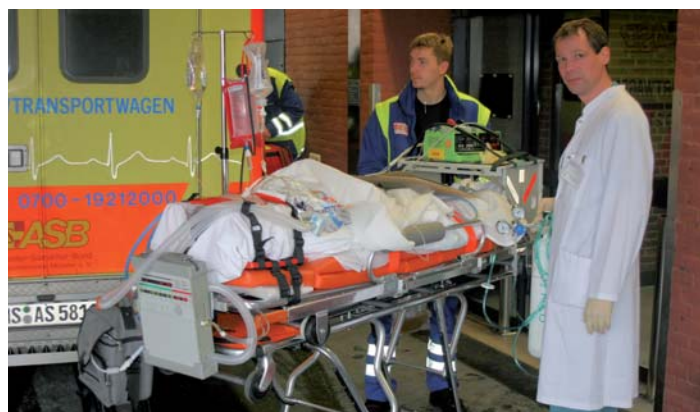
Abb. 4: Fahrbare Patiententrage mit Respirator und laufender pECLA. Versorgung des Oxygenators über eine 2-Liter-Sauerstoffflasche (rechts im Bild)