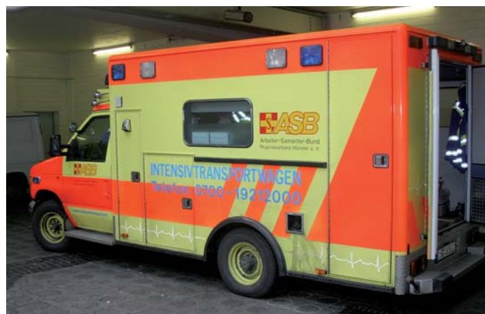
Abb. 3: Intensivtransportwagen für die Patientenverlegung

Während des Transportes besteht die Gefahr eines unerwünschten Abfalls der Körperkerntemperatur, einerseits verursacht durch die jahreszeitlich niedrigen Umgebungstemperaturen, andererseits durch die Abkühlung des Blutstromes bei Passage des extrakorporalen Kreislaufs. Eine Temperierung über den Oxygenator ist nicht