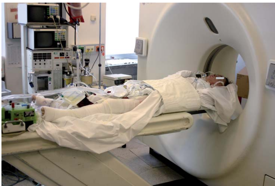
Abb. 5: Durch die kompakten Abmessungen und den geringen technischen Mehraufwand der pECLA war auch die notwendige CT-Untersuchung problemlos.

tensivtransportwagen. Das Fahrzeug bietet mit dem zur Ausstattung gehörenden Beatmungsgerät die Möglichkeit der Fortführung einer differenzierten mechanischen Beatmung auch während des Transportes. Die vergleichsweise großzügigen Innenraumabmessungen gestatten auch die sichere Unterbringung zusätzlicher Aggregate, wie sie beispielsweise bei einer pumpengetriebenen ECMO oder bei der Kreislaufunterstützung mit einer intraaortalen Gegenpulsation erforderlich sind. Die Geräte können dann direkt über das 220-V-Bordnetz versorgt werden. Bei längeren Transportzeiten ist vorab zu klären, ob die Sauerstoffvorräte des Fahrzeuges für die Versorgung des Beatmungsgerätes und der zusätzlichen extrakorporalen Lungenunterstützung ausreichend sind. Zur Vermeidung einer Unterkühlung der Patienten können wärmeisolierende Decken verwendet und die Temperatur im Fahrzeuginnenraum angehoben werden. Dennoch sollte speziell für den Transport überlegt werden, den mitgeführten Gerätefuhrpark auf ein Minimum zu reduzieren. Die Verlegung von Patienten mit laufender pECLA ist mit einem überschaubaren Aufwand möglich. Die geringen gerätetechnischen Voraussetzungen beim Einsatz einer pECLA prädestinieren das Verfahren für diesen Zweck. Eine sorgfältige Patientenselektion ist erforderlich, da die pumpenlose Lungenunterstützung zwar technisch einfach ist, jedoch nicht bei allen Patienten mit kritischem Lungenversagen die erforderliche Unterstützungsleistung erbringen kann.